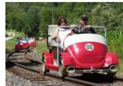
Vélorail (30 mn en voiture)