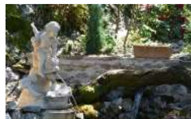
Jardin d'Eden (5 mn à pied)