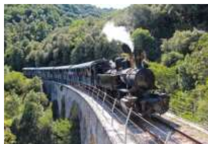
Train de l'Ardèche (10 mn en voiture)