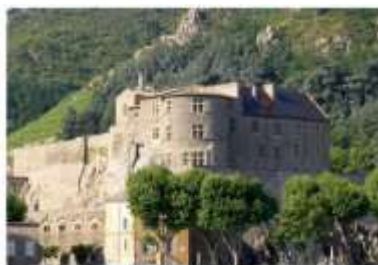
Château-musée de Tournon (5 mn à pied)

Comfortable and heated sanitary facilities are usable and at your disposal with a space reserved for disabled people and babies.